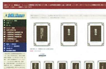
全建ライブラリー